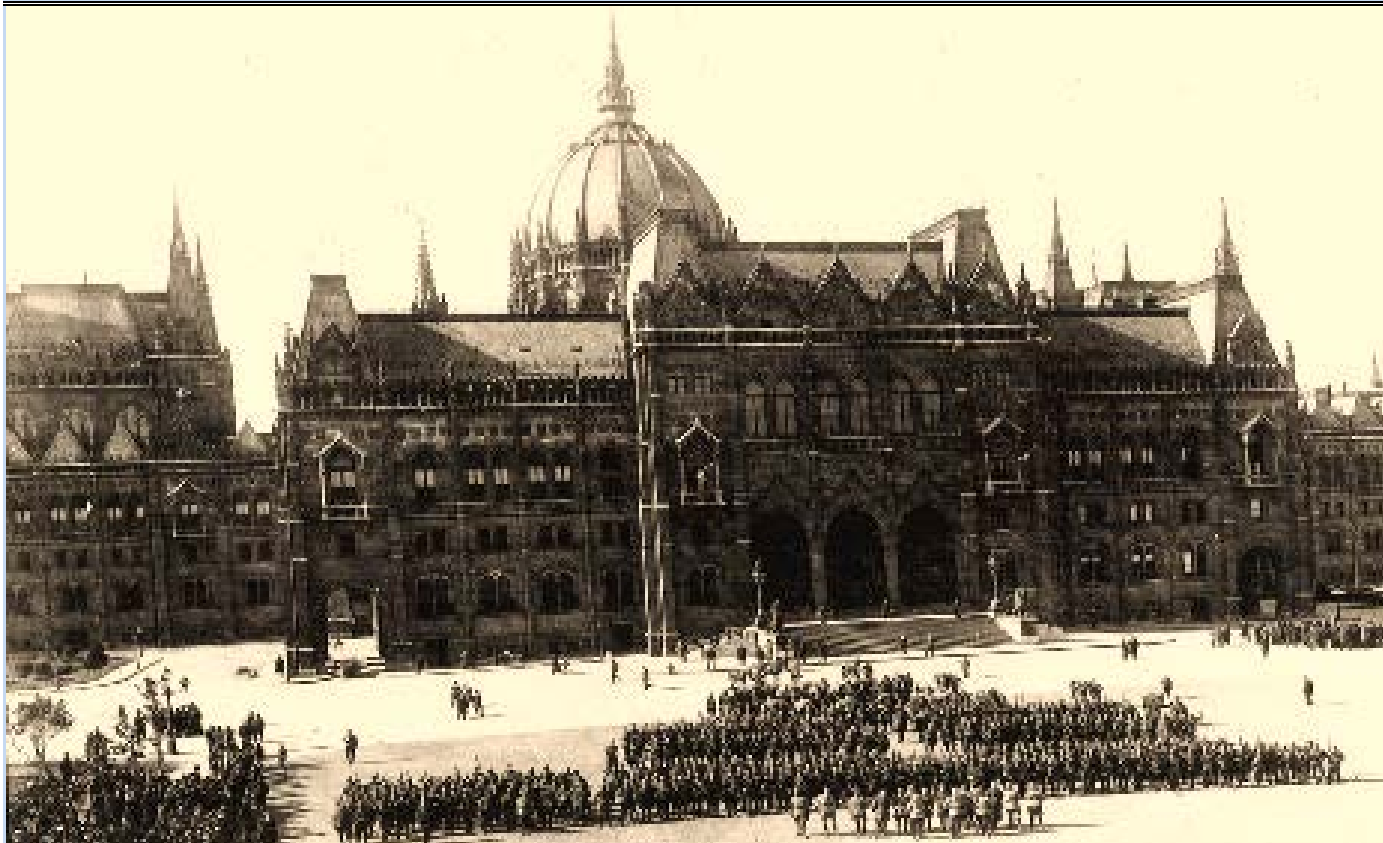
Intrarea triumfală a Armatei Române în Budapesta, la 4 august 1919 Trupele române în fața Parlamentului din Budapesta