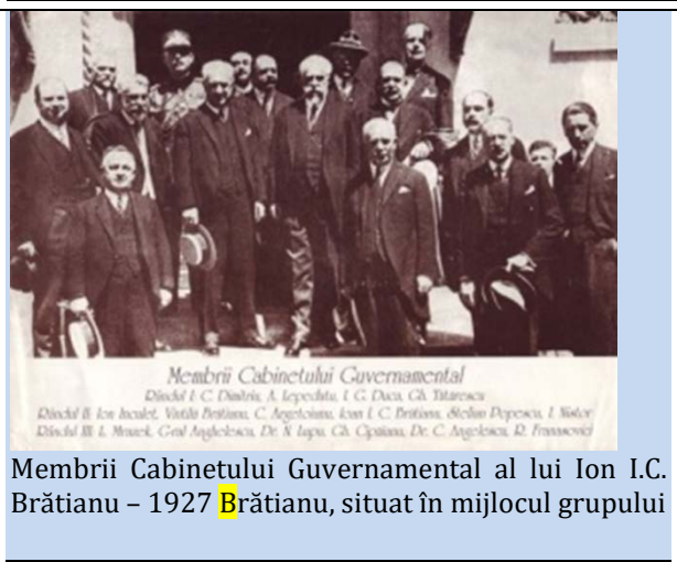
Membrii Cabinetului Governamental al lui Ion I.C. Brătianu – 1927

După încheierea celor patru ani legitimi de guvernare, Ionel Brătianu își depune mandatul de prim-ministru pe 27 martie 1926, precizând că PNL părăsește guvernul ”cu conștiința senină a datoriei împlinite” .