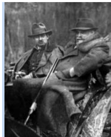
Principele Carol al II-lea și Ionel Brătianu, la vânătoare

Această replică subliniază controlul politic total pe care fruntașul liberal îl avea asupra statului. Sfârșitul activității politice