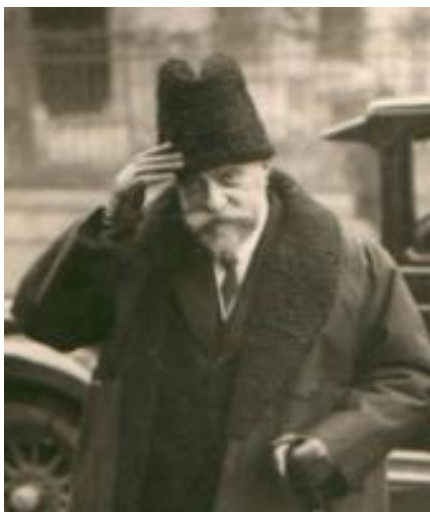
Ion I.C. Brătianu

Același Ion I.C. Brătianu a dominat scena politică românească dintre cele două războaie mondiale, fiind în aceeași măsură aplaudat și contestat.