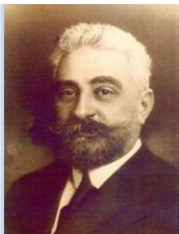
Ion I.C. Brătianu, președintele Partidului Național Liberal, prim- ministrul României

Negocierea inteligentă, abilă și fermă de la Conferința de Pace din Paris