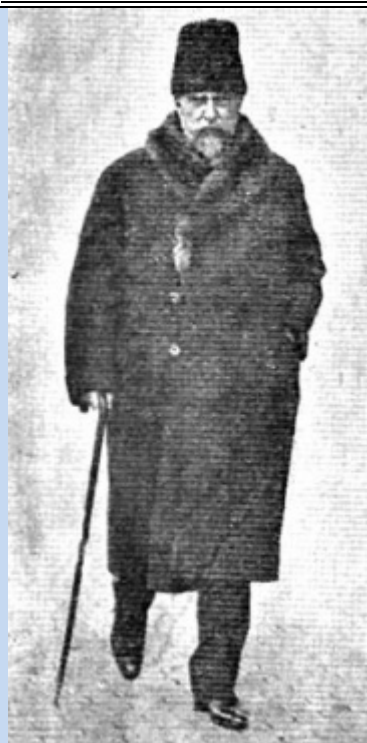
Ion I.C. Brătianu