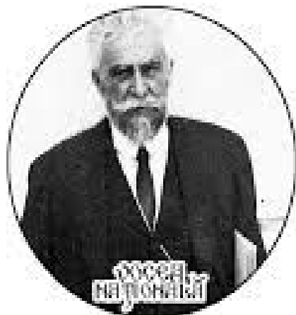
Ion I.C. Brătianu

Brătianu a fost politicianul care a dovedit cea mai puternică rezistență față de încercările marilor puteri de a-și impune voința lor, în dauna independenței României. Iată ce-i scrie Brătianu lui M. Perechide la 3 iunie 1919: "Am moștenit o țară independentă și chiar pentru a-i întinde granițele, nu-i putem jertfi neatârnamarea, lucru ce trebuie știut de fiecare român"