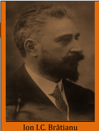
Ion I.C. Brătianu

În finalul ședinței, a luat cuvântul Ion I.C. Brătianu, care a făcut o amplă pledoarie pentru intrarea României în război alături de Antanta, cu trimiteri la istorie: „Cauza românismului a făcut un pas gigantic, din moment ce patru mari puteri au recunoscut dreptul nostru la unitatea națională. Mihai Viteazul este eroul legendar fiindcă a trecut în Transilvania. Așa va fi și cu regele Ferdinand”.