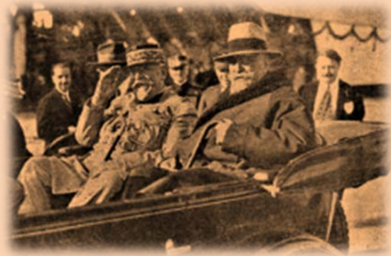
Ionel Brătianu și generalul francez Henri Berthelot în vizită la I.A.R. Brașov