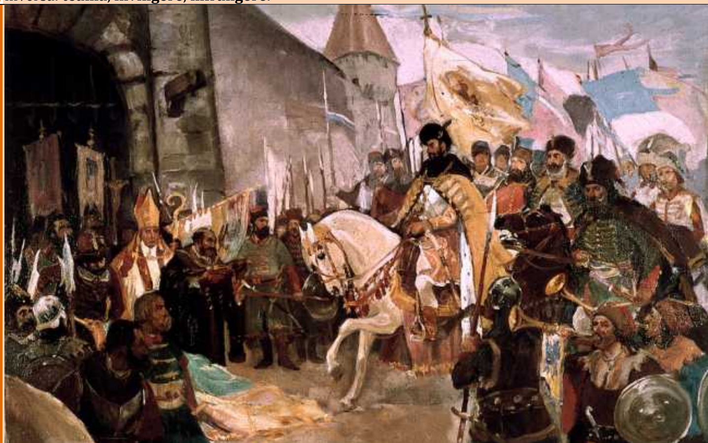
Intrarea lui Mihai Viteazul în Alba Iulia – 1 noiembrie 1599

Rudolf al II-lea era conștient că Mihai Viteazul promova strategia unei politici europene, „pentru gloria neamului său”, care așa cum remarcau mulți contemporani, precum Eustachio Fontana, „în toate discuțiile lor publice sau particulare”, îl asemuiau „datorită mării valori pe care o demonstrează în aceste părți ale Europei” ca pe un „ nou Alexandru Macedon. ” (cf. Mircea Dogaru, op. cit., p. 106)