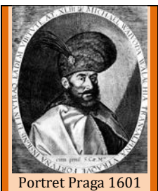
Portret Praga 1601

„Faptele lui îl pomenesc pe Omul trimis de Dumnezeu care acum trei sute de ani a venit pe pământ să facă un singur trup din românimea întreagă.” (Nicolae Iorga-București, 1901)