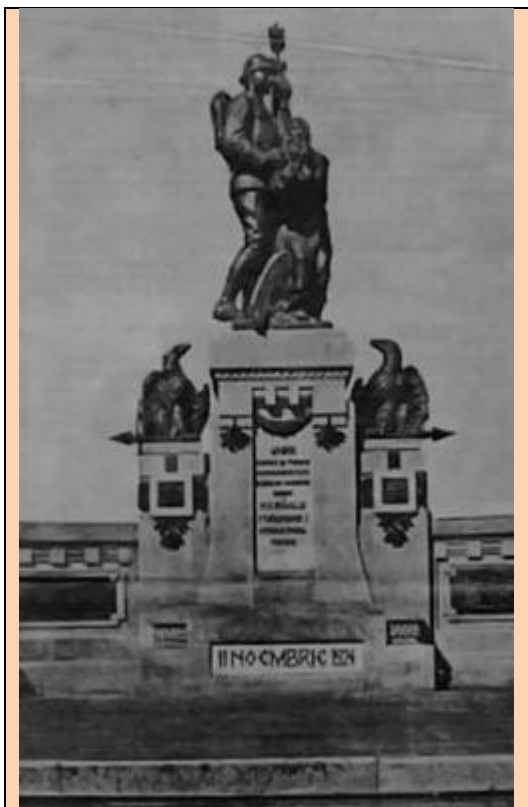
Monumentul unirii Cernăuți

Câteva zile mai târziu, la 14/27 octombrie, la Cernăuți, se întrunea „Adunarea Constituantă a românilor din Bucovina”, compusă din reprezentanți ai tuturor grupărilor politice din provincie, deputații români ai Parlamentului din Viena, foștii deputați ai Dietei ducale, primarii români din