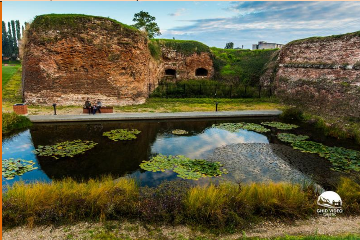
Vedere din parcul cetății

protopop Daniil „ vebânit în pământul Ardialului în zilele lui Io Mihai voievodu, cu fratele Vasile Rufa ” 32 . Din scrisoarea vice-căpitanului orădean rezultă că Mihai era reprezentat în sudul Crișanei de cel pe care, câteva luni mai târziu, domnul român îl va numi într-o scrisoare „ ispravnicul nostru de la Ineu ”. Acesta era probabil acel voievod Fărcaș care, la 1577, își avea reședința la Hălmagiu și pe care, în 1599, îl găsim în fruntea cetății din această zonă a Crișanei 33 .