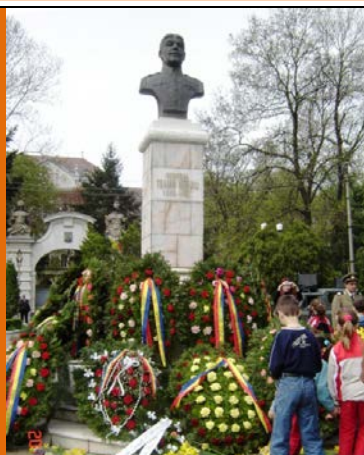
Bust Moșoiu - Oradea - 1992 sculptor col. Teodor Zamfirescu