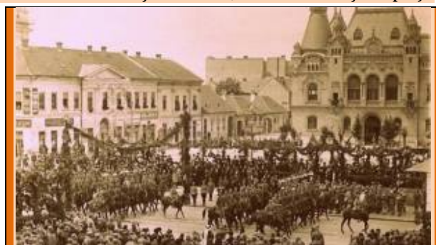
Trupe ale generalului Traian Moșoiu – la Oradea în mai 1919 - în fața palatului Episcopiei gr.-cat.