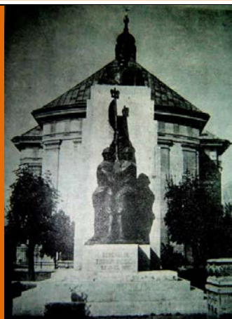
Statuia generalului Traian Moșoiu – 1938 Oradea

La propunerea Asociației Naționale a Cavalerilor de Clio, Sala mare de Consiliu , din Primărie și o stradă din centrul orașului poartă numele generalului. În 12 octombrie 1992, statuia generalului a fost așezată în fața Comandamentului Diviziei 11 Mecanizate „Carei”, realizată prin contribuția cadrelor militare active și în rezervă din Ministerul Apărării și de Interne, sponsorizată de întreprinderi din Județul Bihor. Un regiment și drapelul său de luptă au luat numele Regimentul 21 Mecanizat „general Traian Moșoiu”, în curtea căruia, prin efort financiar propriu, s-a așezat un bust al eroului, ca veșnică amintire a celor care-i continuau tradiția, purtându-i numele!