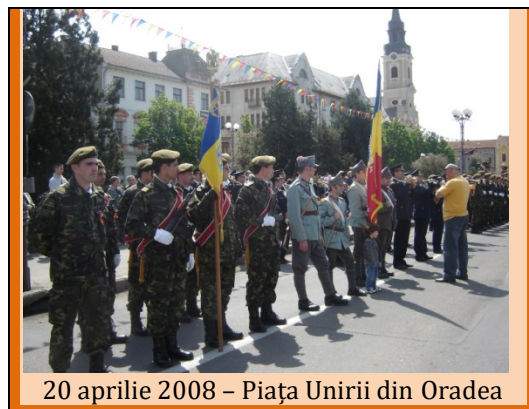
20 aprilie 2008 – Piața Unirii din Oradea

Între contemplațiile mele din săptămâna Patimilor, în fața morții, ce-mi bătea la ușă, am cetit o carte din suflet femeiesc: „Gândurile și icoanele din vremea războiului”, zugrăvind suflarea morții, ce a trecut peste suflarea românească în acest crâncen război. Acest suflet artistic a cuprins întreg calvarul îndurat de țara mamă pentru eliberarea noastră. Acest suflet înălțat este Regina Maria. Femeia română a fost totdeauna vestalia iubirii de neam. Corneliile și Veturiile romane, Mama lui Ștefan cel Mare și altele la întâlnirea lor de dincolo de mormânt, vor recunoaște în tipul sublim a Reginei Maria pe vrednica reprezentantă a femeii române. Și o aureolă cerească va fi cununa răsplătirii Sale.