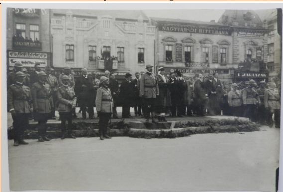
23 mai 1919 – Regele Ferdinand I la Oradea

România a fost încălcată și jefuită în chipul cel mai barbar. Pe unde au trecut dușmanii noștri, a rămas jale și prăpăd. D-voastre, ardelenii, ați fost deprinși cu suferințele, la noi contrastul însă a fost grozav de izbitor. Bunul Dumnezeu ne-a scăpat însă din robie străină pe toți: pe noi, după un an, pe dv. după o mie