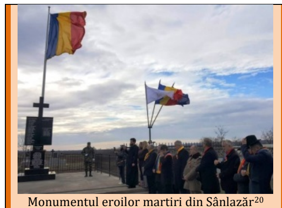
Monumentul eroilor martiri din Sânlazăr 20