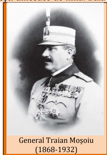
General Traian Moșoiu (1868-1932)