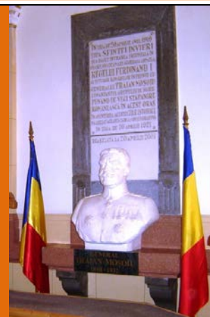
Placa de onoare și Bust din Primărie 2001– sculptor Ioan Mihele