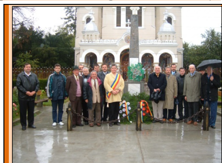
La Tinca – pe urmele eroilor – 2005 Comisia Română de Istorie Militară

De simpatie și de o călduroasă primire s-au bucurat și subunitățile care au înaintat pe valea Crișului Negru spre Salonta. Există multe declarații și memorii care certifică această atitudine și stare de mulțumire și bucurie. Regimentul Horea a fost primit la Beliu cu „pâine și sare, iar femeile le-u dat soldaților hrană rece”. O primire asemănătoare au făcut și comunele Tămașda, Talpoș. De un interes aparte este relatarea primirii din 21 aprilie 1919, din Ucuriș, după însemnarea făcută de preotul paroh: