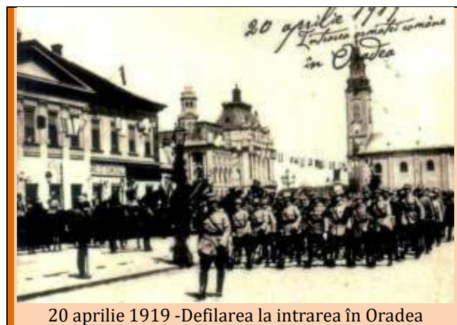
20 aprilie 1919 -Defilarea la intrarea în Oradea

Desigur șirul exemplurilor ar putea continua. Dintre toate însă, manifestația de la Oradea a fost cea mai amplă și însuflețitoare despre care însuși Nicolae Iorga a spus că a reprezentat O ZI DE GLORIE . În adevăr, 20 aprilie 1919 , a fost ziua învierii Domnului și a orașului Oradea Mare, orașul martir care trăise săptămâna patimilor , a însemnat un moment istoric în viața locuitorilor săi, pentru că: „ Nici o parte a românismului nu a fost expusă atât de mult pieirii ca țara Bihorului ”, - arăta vicarul ortodox de Oradea Roman Ciorogariu, nimeni altul decât cel care, cu câteva ore înaintea intrării