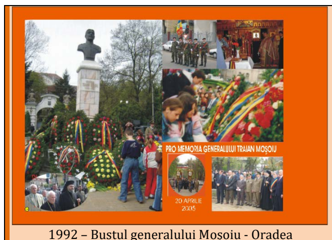
1992 – Bustul generalului Moșoiu - Oradea