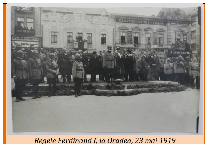
Regele Ferdinand I, la Oradea, 23 mai 1919

Pe direcțiile de înaintare: pe văile Crișului Negru, Crișului Repede, Barcău și dinspre Arad spre Oradea armata română a fost primită cu un mare fast sărbătoresc, cu flori de liliac, cu salutul zilei TRĂIASCĂ ROMÂNIA MARE! Pe aceste direcții toată lumea s-a pregătit de sărbătoarea Învierii, care spontan s-a transformat și într-o sărbătoare