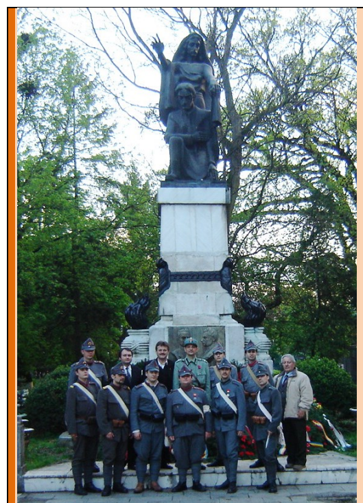
Tradiția militară – 2008 - la statua martirilor Ciordaș și Bolcaș din Beiuș

Nu mult după aceasta au amuțit și clopotele ce ne-au mai rămas la biserici, iar bieții creștini veneau la sfânta slujbă mai mult pe furiș și cu groaza în spate. Dar paharul amărăciunii nu s-a umplut cu atâta. Văzurăm preoți destituiți, purtați în lanțuri și alții condamnați la moarte. Averele la mulți este confiscată, iar la alții, care erau în drumul pe unde se retrăgea armata roșie, li s-a distrus totul. Și așa în postul mare bisericile au rămas aproape goale, păstorii risipiți, iar turma împrăștiată.