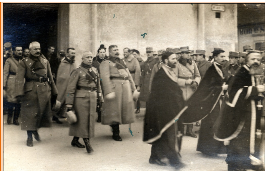
Gl. Gh. Mărdărescu, gl. Traian Moșoiu - la ieșirea din Catedrala cu lună, 1919

Până la ofensiva din aprilie, adică în perioada dintre sărbătorile de Crăciun 1918 și Sfintele Paști 1919 poporul roman a fost prigonit, preoții și învățătorii trecuți pe liste negre și urmăriți, la tot pasul, de jandarii unguri. Cel mai mic gest era interpretat ca nesupunere și sancționat. Organele politice și administrative transmiteau ordinele și dispozițiile lor prin intermediul preoților și a școlilor de pe întreg teritoriul Ardealului. Redăm câteva documente relevante pentru susținerea acestei teze. Consiliul Dirigent pentru combaterea propagandei ungurești din Ardeal trimitea circulare prin care se