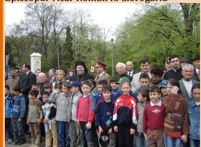
Oradea, 20 Aprilie 2005 Omagierea generalului Traian Moșoiu