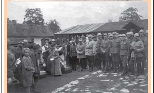
Împărțirea hranei săracilor din Budapesta – 1919 (fototeca autorului)