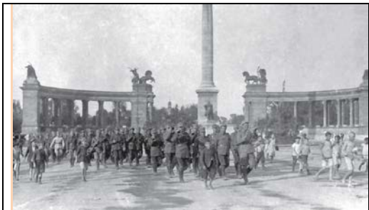
August 1919. Trupele romane defilând în Piața Coloanei Mileniului din Budapesta 1

Numai într-o singură zi –informa proclamația – au fost puse la dispoziția populației de către conducerea trupelor române peste 70.000 rații de pâine de câte 400 grame fiecare: În rezumat, se face tot ce este „omenește posibil pentru ca populația orașului să nu sufere” 5 .