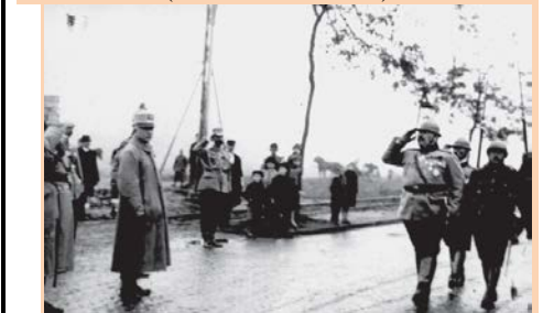
Generalul Traian Moșoiu defilând la Budapesta

La 1 august 1919, grupurile generalilor Holban și Moșoiu, introducând noi forțe în capul de pod de la Tisa, au reușit să-l lărgească și să împingă limitele dinainte ale cestuia spre vest, pe distanțe variind între 5 și 10 km. Marile unități de cavalerie au înaintat pe direcțiile ordonate pentru a cerceta și a descoperi sectoarele de concentrare a grupărilor principale inamice, a tăia liniile de retragere ale acestora și a intercepta căile ferate spre Budapesta. Grupurile Holban și Moșoiu au reușit într-un scurt interval să pătrundă adanc între cele două grupări principale ale inamicului, interzicând orice încercare de joncțiune a acestora.