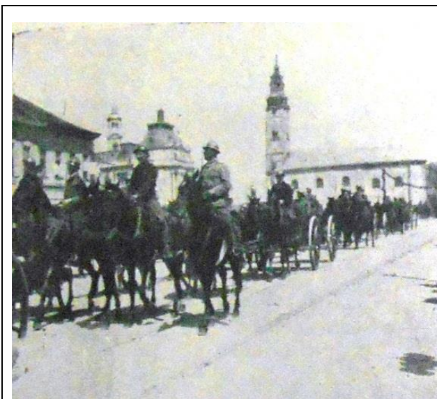
20 Aprilie 1919 – intrarea trupelor române de artilerie în Oradea