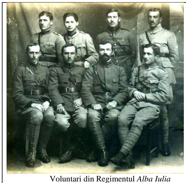
Voluntari din Regimentul Alba Iulia