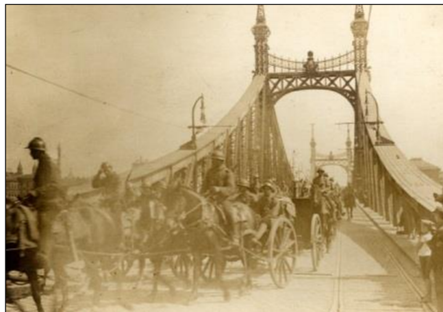
Artilerie română în marș pe podul Franz Joseph din Budapesta

Regele Ferdinand I personal, la 14 aprilie 1919, trimite o scrisoare lui I. I. C. Brătianu, aflat la Paris, apreciind că „lipsa de decizie a Puterilor Aliate” a lăsat timp armatei ungare să se concentreze și să se organizeze mai bine”. De aceea, regele considera „înaintarea noastră în Transilvania ca o necesitate absolută, atât din punct de vedere al politicii noastre externe, cât și din acela al situației interne”.