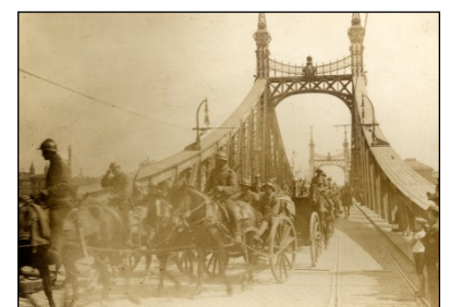
Artilerie română în marș pe podul Franz Joseph din Budapesta