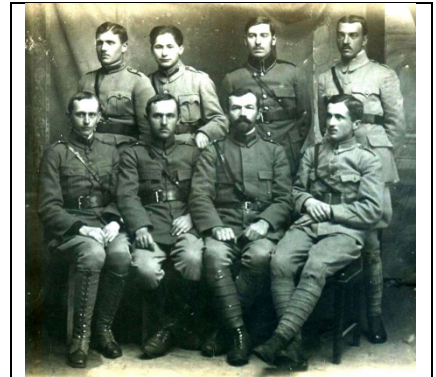
Voluntari din Regimentul Alba Iulia