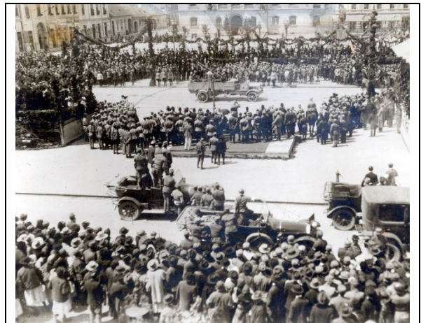
Populația din Oradea - mare asistând la parada trupelor române - 23.05.1919

Obiectivul celei de-a doua etape fusese atins. Marele Cartier General a solicitat acordul Înaltului Comandament Interaliat de continuare a ofensivei până la Tisa, din considerente de ordin militar. Dintre aceste considerente amintim: concentrarea armatei ungare în raioane favorabile declanșării unei contraofensive; adâncimea fâșiei de apărare de pe aliniamentul Satu Mare, Carei, Oradea, Arad nu permitea executarea unor manevre ale rezervelor pentru întrebunțarea lor eficientă în orice sector; necesitatea de a stopa evacuarea rechizițiilor efectuate în Ardeal. Argumentele de ordin militar se pare că au prevalat, fapt pentru care generalul Franchet d'Esperey aprecia că ofensiva română „va avea în Orient