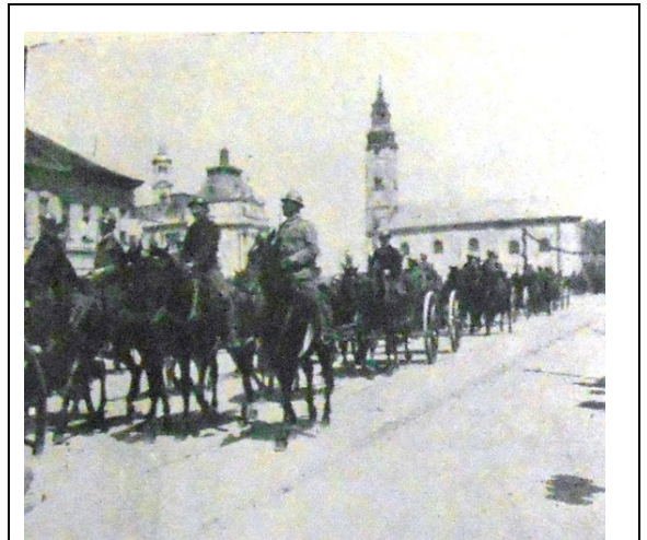
20 Aprilie 1919 – intrarea trupelor române de artilerie în Oradea