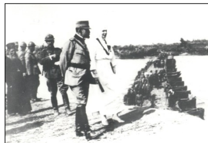
Regele FERDINAND I și Regina MARIA pe podul de pontoane de la Tisa

În temeiul acestei hotărâri, Marele Cartier General a dat Ordinul de operații nr.281 prin care dispunea o nouă grupare a forțelor, în vederea operațiunilor ce se vor executa spre vest. Astfel, prin ordinul de operații 4454 se dispunea înlocuirea Diviziei 7 din sectorul de Nord cu Divizia 2 Cavalerie, cu punctul de comandă la Baia Mare. Divizia 2 Vânători a înlocuit Divizia 1, concentrată la Brad, în