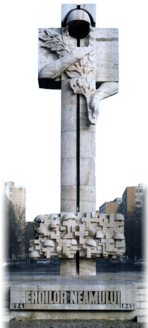
Fig. 54 – „Monumentul Eroilor Neamului”, Victor Gaga

Blaga de la Cluj sau Lancrăm , opere ale ilustrului sculptor Romulus Ladea , Andrei Mureșan la Brașov, autor Virgil Fulicea sau austerul monument de pe Muntele Bobâlna , închinat memoriei țăranilor răsculați în 1437, realizare a arhitectului Salvanu și a sculptorului Kos Andras . Astfel putem continua enumerarea, apropiindu-ne de prezent cu Fântâna Martirilor realizat în 1994 în Timișoara, conceput și realizat de regretatul Victor Gaga 7 și tot din același oraș martir Monumentul Eroilor Neamului (Fig.54) de pe drumul Șagului, de același autor, coborând la