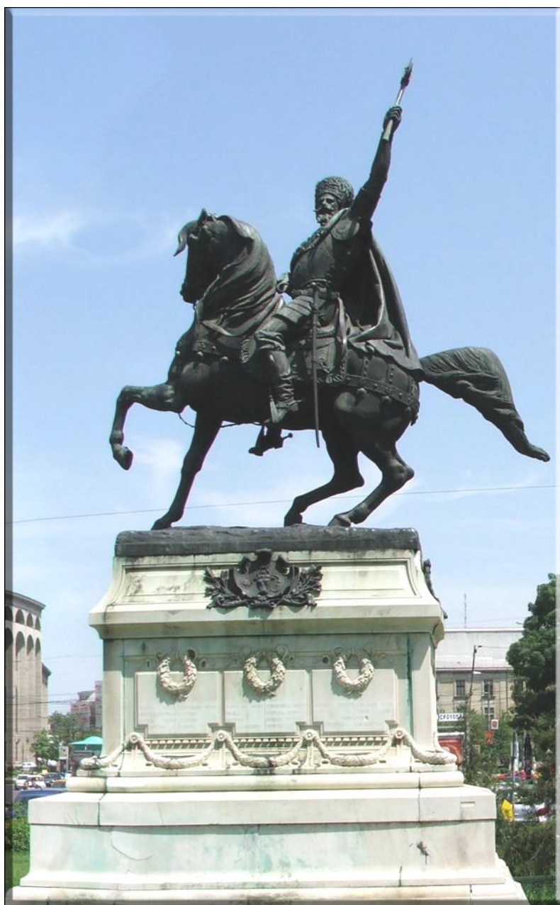
Fig. 47 – „Mihai Viteazul”, Albert Ernest Carriere de Belleuse (București)

Arta sculpturală românească a secolului XX, a dat mari personalități în sculptura monumentală de for public, înscrisă cu evidență în cele mai bune și valoroase tradiții ale artei plastice românești din secolul al XIX-lea, cu „mijloace aflate în continuă și salutară evoluție”, prin excelenți reprezentanți ai unor generații din partea a doua a celui din urmă secol al ultimului mileniu, precum George Apostu prin lucrări care regenerează prin tehnica cioplirii simțul monumentalului 5 , influențând și tehnica modelajului, ca de pildă la Paul Vasilescu , Constantin Popovici sau Mircea Spătaru .