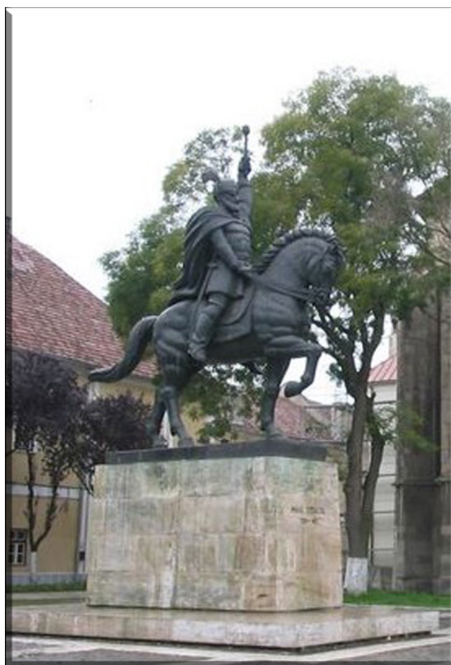
Fig. 55 – „Mihai Viteazul”, Oscar Han (Alba Iulia)