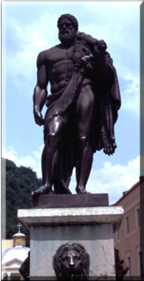
Fig. 50 – „Hercule” (Băile Herculane)