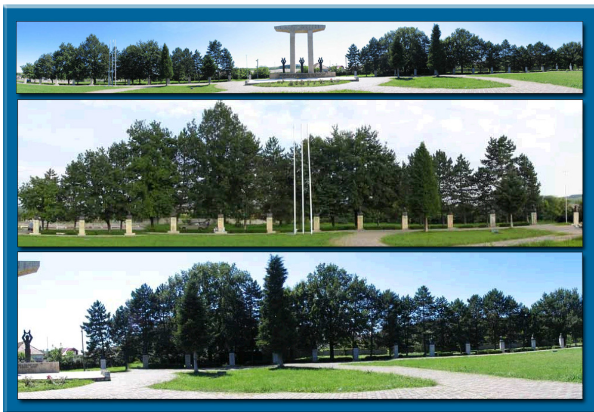
Fig. 56 – „Monument omagial”, (Câmpia Libertății – Blaj)