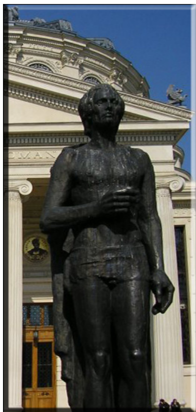
Fig. 52 – Mihai Eminescu Gh. Dimitrie Anghel

București, realizat în 1923 de Ion Jalea și Corneliu Medrea, Arcul de Triumf, autor Ion Jalea, Mausoleul de la Mărășești – 1930 (Fig. 53) de același autor, Monumentul Unirii din Focșani sau Mircea cel Bătrân de la Tulcea de Ion Irimescu, Dimitrie Cantemir de același remarcabil artist la Oradea.