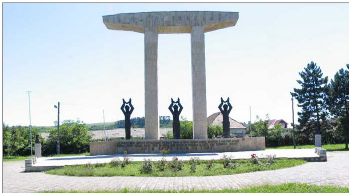
Fig. 56 – „Monument omagial”, (Câmpia Libertății – Blaj)

Exemplificările noastre cu bogăția de monumente de for public din spațiul românesc ar